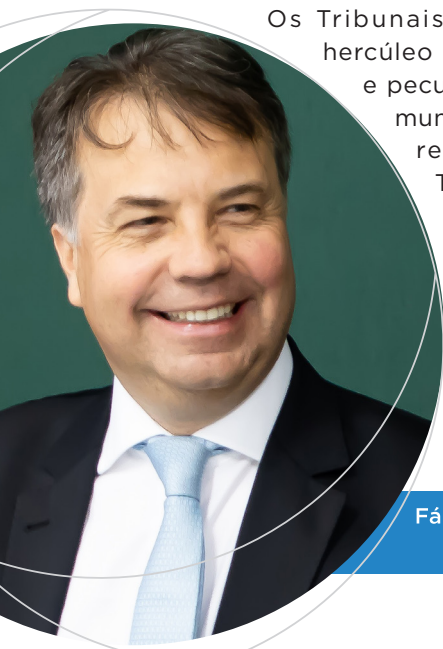
Fábio Túlio Filgueiras Nogueira Presidente da Atricon

Os Tribunais de Contas protagonizam um esforço hercúleo - consideradas as dimensões continentais e peculiaridades regionais de um país com 5.570 municípios - para que a Administração Pública responda satisfatoriamente à sociedade. Trata-se de uma atuação que perpassa a observância da conformidade/legalidade dos gastos públicos, a partir da adoção de um modelo inovador que se tem denominado “Controle Externo Contemporâneo”, baseado em auditorias concomitantes, em orientações pedagógicas, em uma sistemática de fiscalização que precede o erro e evita o dano.