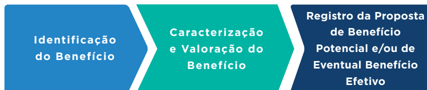
Figura 1 - Primeira etapa do processo: registro da proposta de benefício potencial e/ou de eventual benefício efetivo

de sua caracterização e valoração e, por fim, do registro da proposta de benefício potencial e/ou de eventual benefício efetivo.