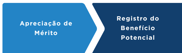
Figura 2 - Segunda etapa do processo: registro do benefício potencial

Na sequência, a Figura 2 resume a segunda etapa a qual envolve os subprocessos de apreciação do mérito, a cargo do Colegiado competente, conforme o caso, com o registro do benefício potencial que melhor representa a decisão da Corte.