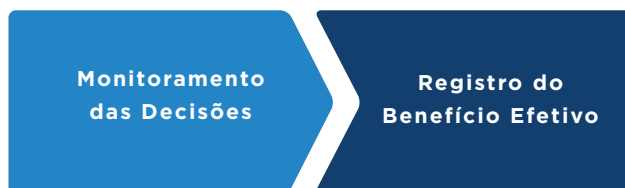
Figura 3 - Terceira etapa do processo: Registro do benefício efetivo

A terceira etapa, ilustrada na Figura 3, ocorre, em regra, na fase de monitoramento das decisões exaradas pelo Colegiado das Cortes e resulta no registro do benefício efetivo. Todavia, benefícios efetivos também já podem ser observados durante a fase instrutória ou no curso de uma fiscalização, conforme abordado no item 1.6.3, a seguir.