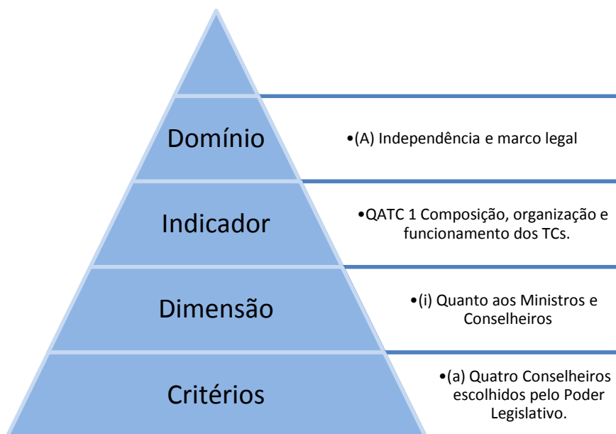
Diagrama 1. Terminologia do QATC (baseada no SAI-PMF)

Os indicadores abrangem de uma a quatro dimensões, que podem conter vários critérios. Uma ilustração de como o sistema de indicadores é construído é apresentada no diagrama a seguir: